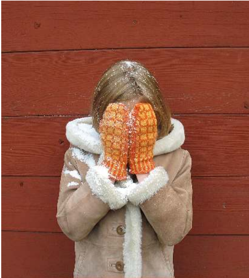
Modèle: Claire

Création de Kerry Palm Traduction par Le gars qui tricote